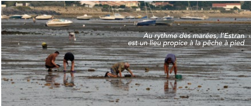
Au rythme des marées, l'Estran est un lieu propice à la pêche à pied