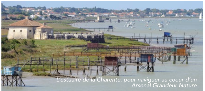
L'estuaire de la Charente, pour naviguer au coeur d'un Arsenal Grandeur Nature