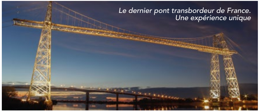
Le dernier pont transbordeur de France. Une expérience unique