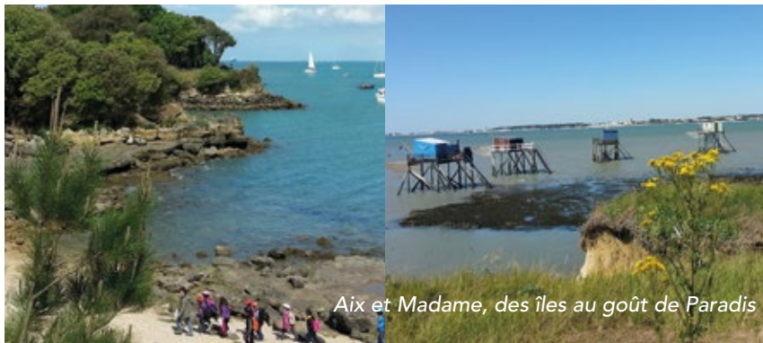
Aix et Madame, des îles au goût de Paradis

Rochefort Océan, un territoire entre terre et mer