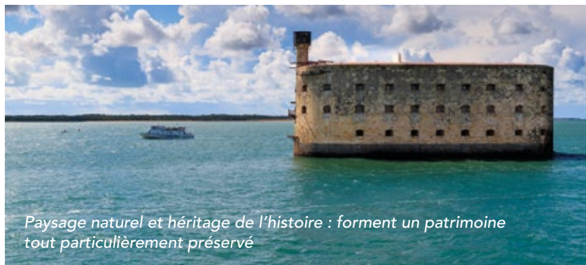
Paysage naturel et héritage de l'histoire : forment un patrimoine tout particulièrement préservé

Rochefort, une Ville Arsenal devenue Ville d'Art et Histoire