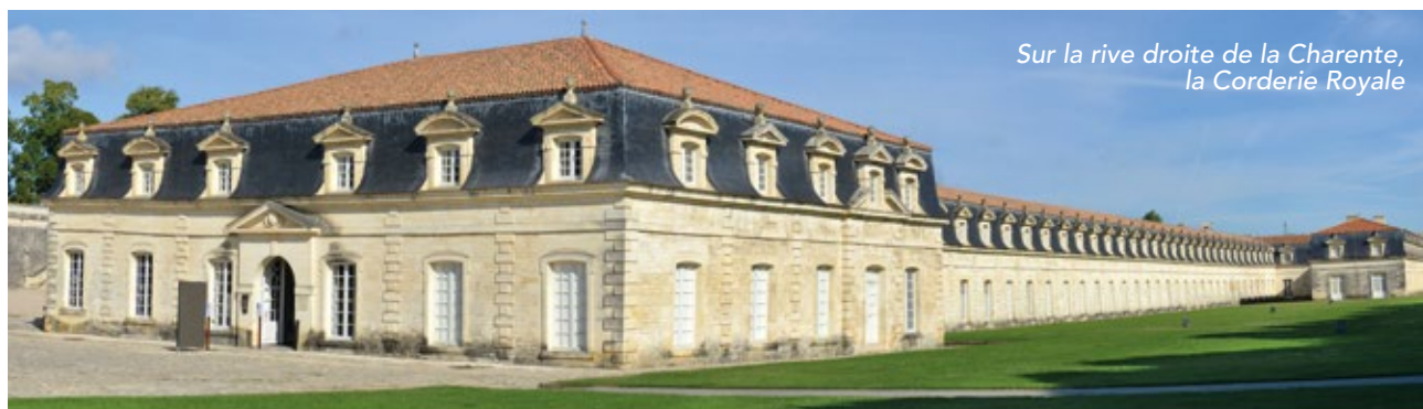
Sur la rive droite de la Charente, la Cordierie Royale

Rochefort, une Ville Arsenal devenue Ville d'Art et Histoire