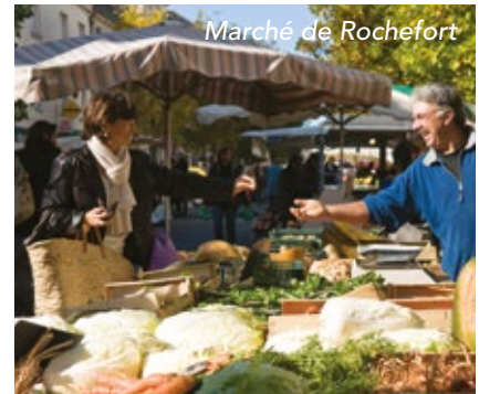
Marché de Rochefort