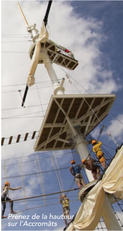
Prenez de la hauteur sur l'Accromâts