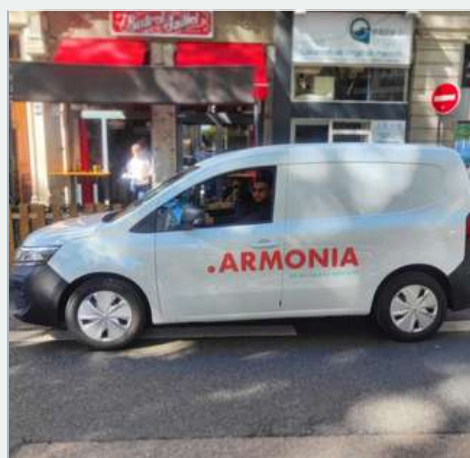
Je favorise le co-voiturage pour baisser mon empreinte carbone