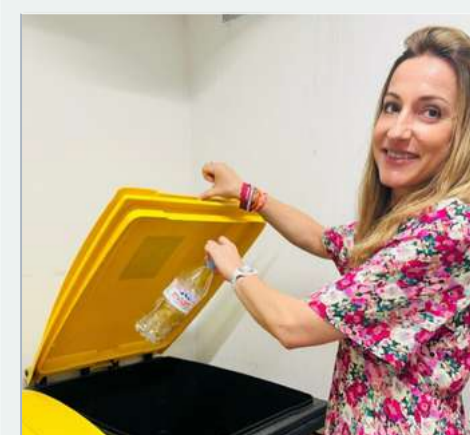
Les bouteilles en plastiques c'est dans les bacs jaunes !