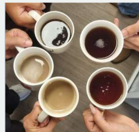
J'utilise un mug lavable au lieu de verres en plastique jetable