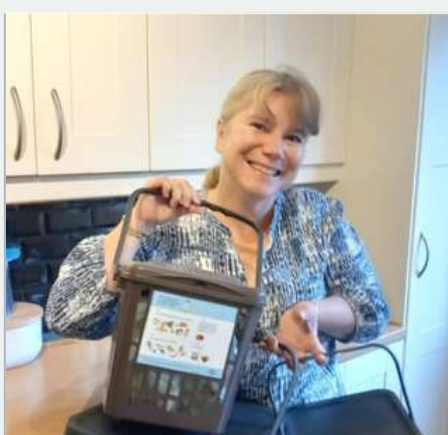
Je trie aussi mes déchets organiques dans la poubelle appropriée. La collecte permet de faire du biogaz.