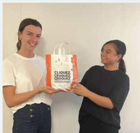
Nous partageons un sac pour le déjeuner pour éviter l'utilisation abusive des sacs en papier