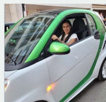
Je roule à l'électrique pour réduire mon empreinte carbone