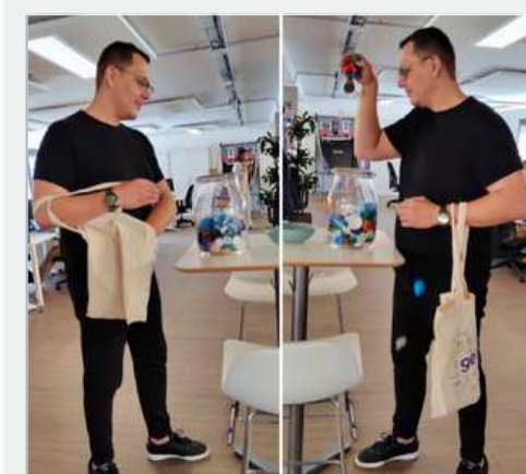
Je collecte et fais recycler des bouchons pour financer des équipements pour personnes handicapées