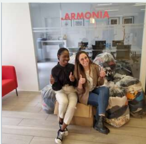
Je collecte des vêtements pour l'association TISSECO qui permet de faire travailler des personnes fragilisées en parcours d'insertion