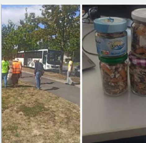
Nous avons ramassé 13 kgs de déchets et 469 mégots lors d'un cleaning day !