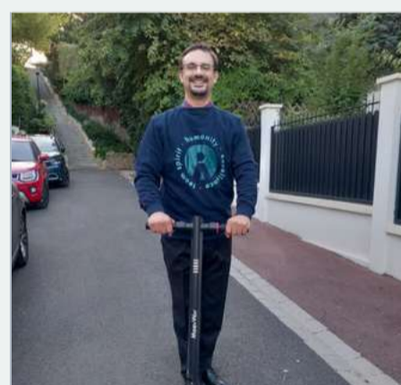
Je pollue moins en utilisant ma trottinette électrique