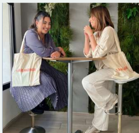
Nous partageons un moment convivial dans l'espace vert