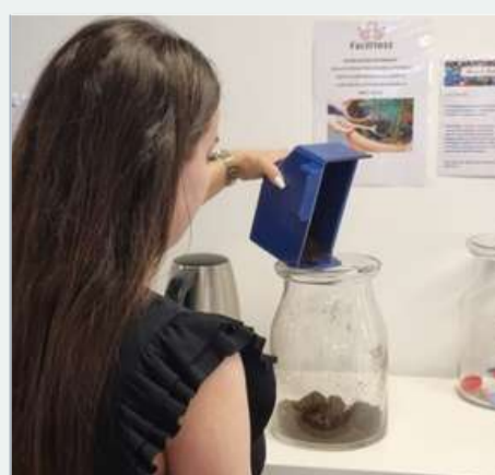
Je récupère mon marc de café pour vivre une seconde vie