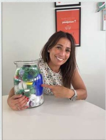
Je collecte et fais recycler des bouchons pour financer des équipements pour personnes handicapées