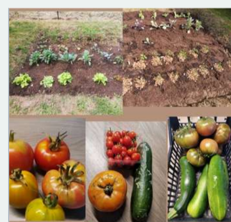
Grâce au marc de café je fais pousser des légumes bio dans mon potager