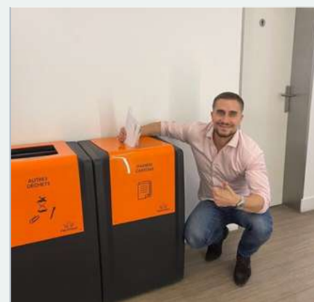
Je prends le réflexe de trier mes déchets dans les poubelles appropriées