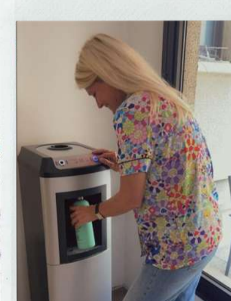
Je bois dans ma gourde pour éviter la vaisselle à usage unique