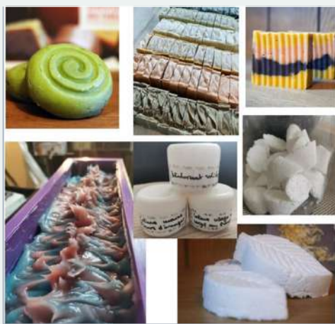
Je fabrique des produits cosmétiques bio moi-même