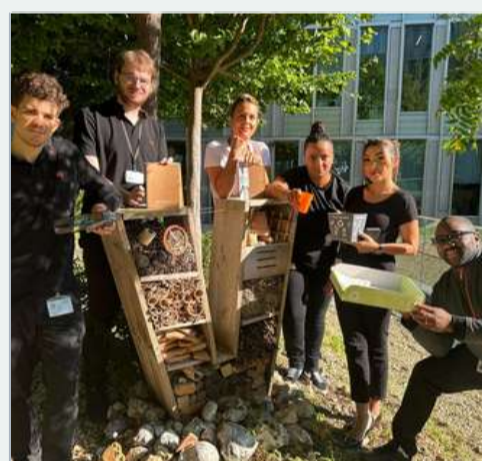
Cabane aux insectes, gourde réutilisable, cahier en papier recyclé, crayons plantables, corbeille éco-responsible nous ne manquons pas d'idées !