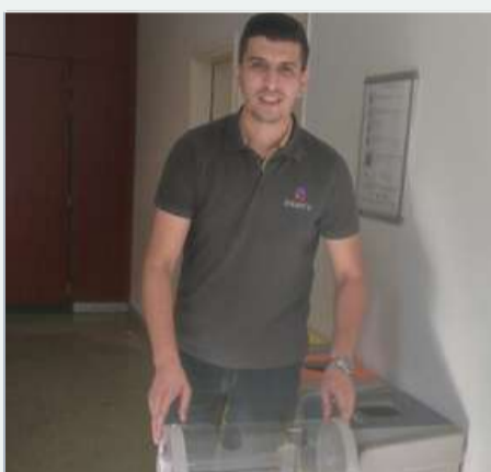
Je collecte, trie et recycle les piles