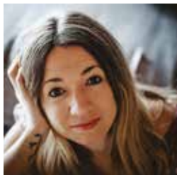
Laure Coutaz © LEM Photographie