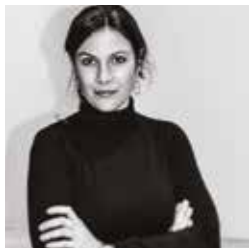
Barbara Terpoorten © Soblue Weina